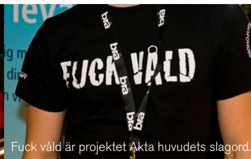
Fuck våld är projektet Akta huvudets slagord.